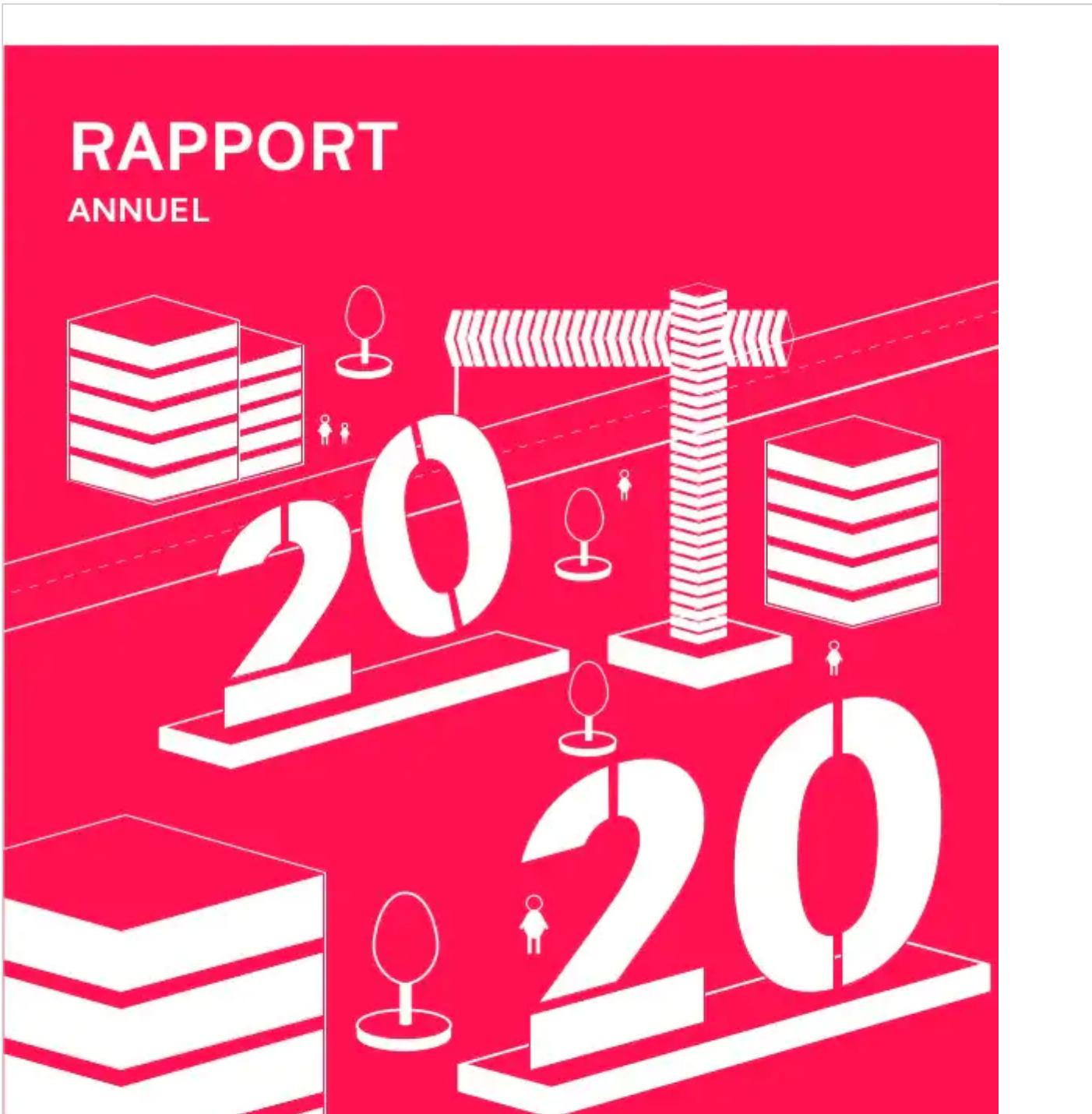
Rapport annuel Fonds Kirchberg de Paperjam_redaction