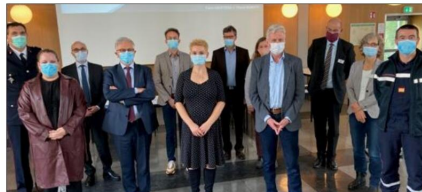
Les différents partenaires du projet ont tenu une réunion de lancement du projet GeKo à Sarrebruck.

Le budget total de GeKo : 1 021 638 €. L'ARS Grand Est apporte 100 000 €, le ministère Santé de Sarre 100 000 €, la MGEN 185 950 € et la SHG Kliniken Völklingen 172 883 €. L'Eurodistrict met 462 805 € sur la table. L'Union européenne cofinance à hauteur de 618 270 € K€ de crédits Feder Interreg.