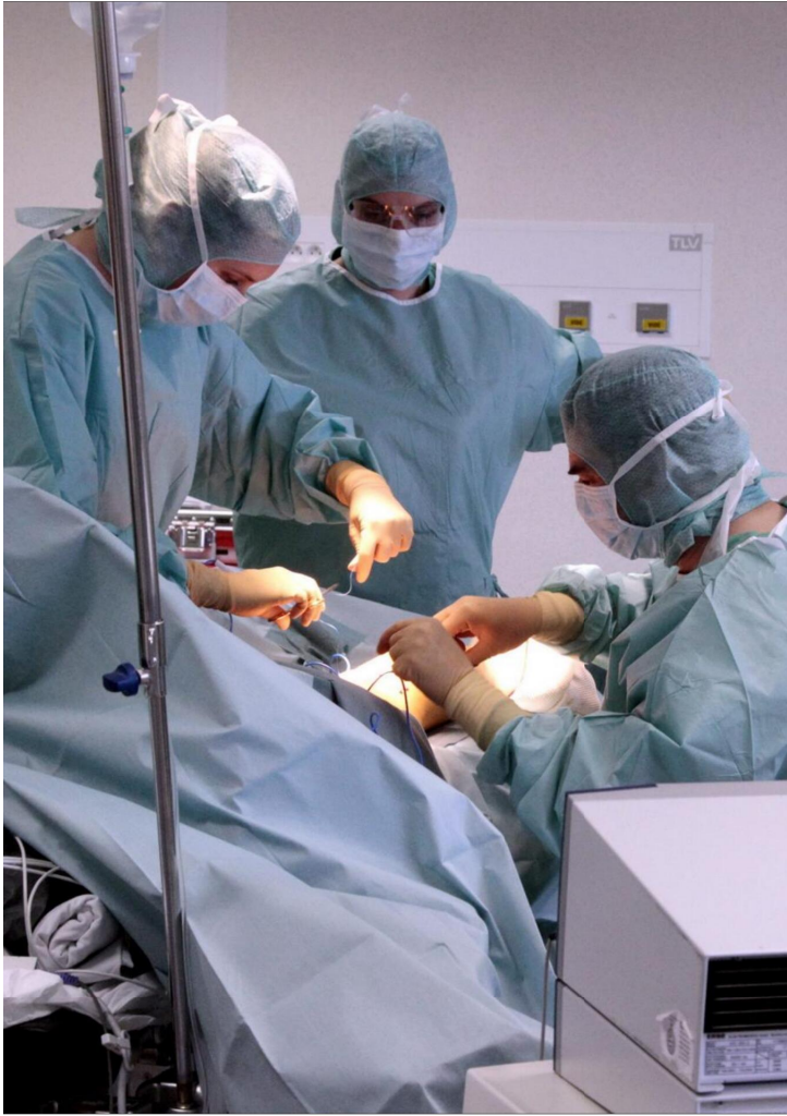
Le but de GeKo : faire en sorte que la frontière n'existe plus entre les hôpitaux de Moselle-Est et de Sarre, surtout en matière d'urgence vitale.